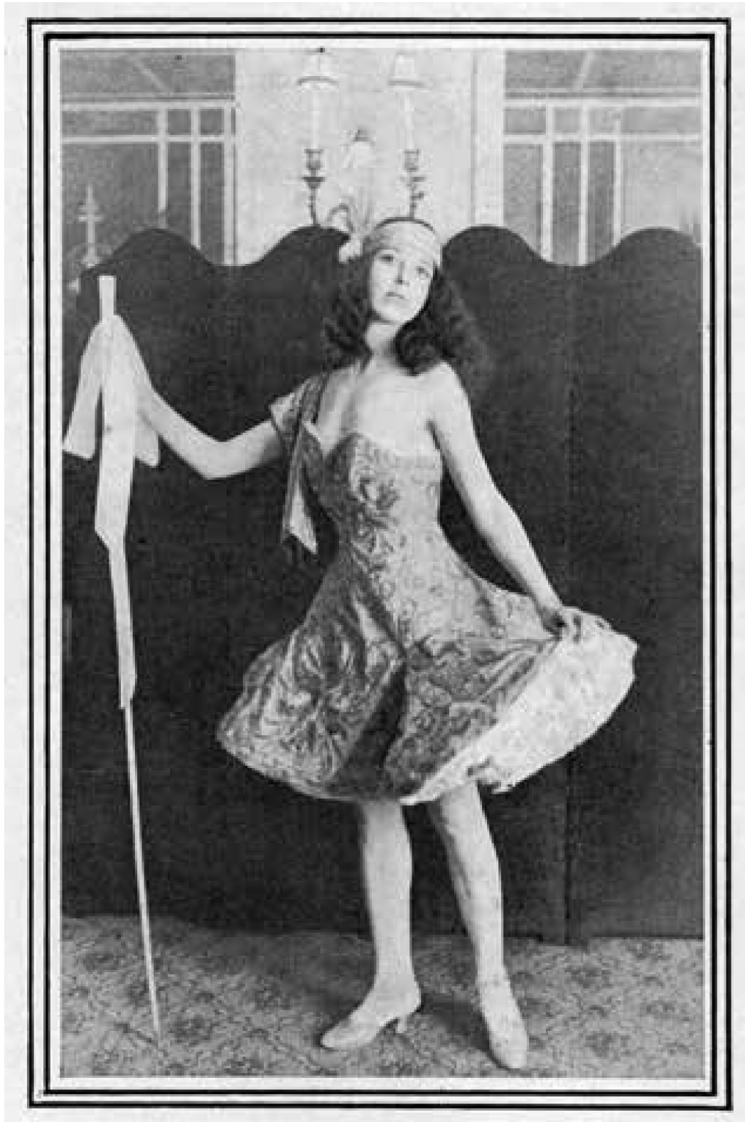
Musidora personnifie le music-hall, Le Music-Hall illustré, n° 25, 1 er janvier 1913, p. 3.