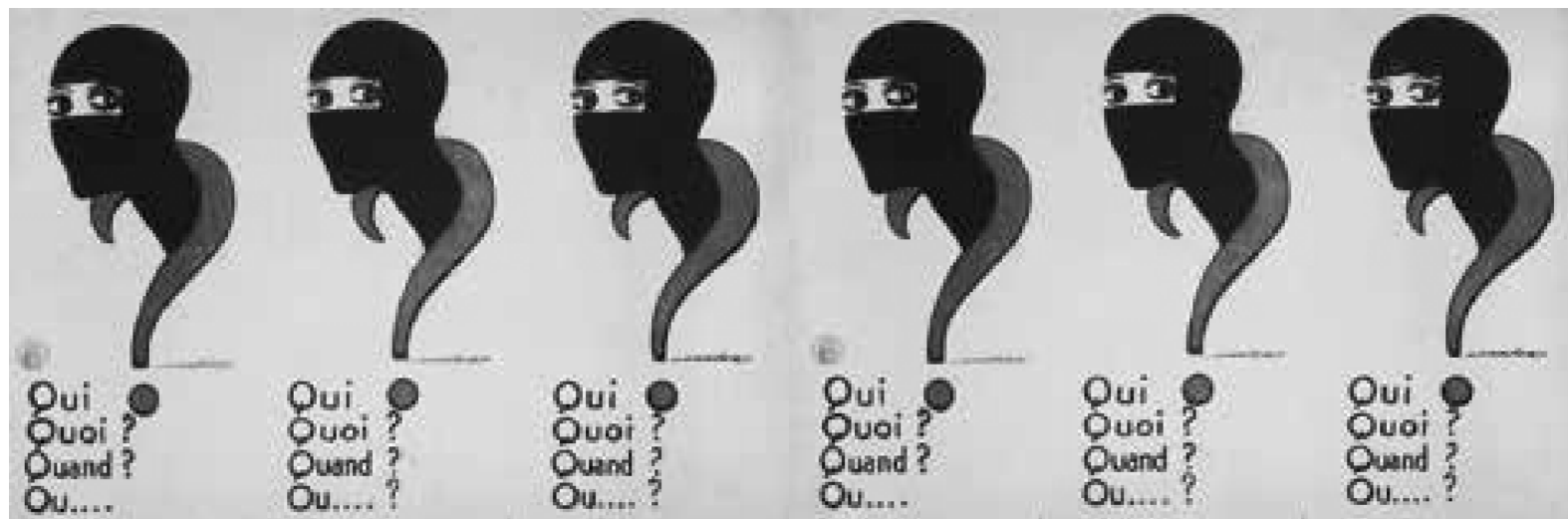
Affiche des Vampires (1915) signée Maurice Harford.

En forme de point d'interrogation, une tête de femme cagoulée de noir s'affiche sur les murs des villes de France et d'ailleurs. Qui ? Quoi ? Quand ? Où ? C'est Irma Vep, alias Musidora, alias Jeanne Roques, muse-artiste, femme et vamp, née à Paris en 1889 et amenée à figurer pour toujours au firmament des étoiles du cinéma mondial.