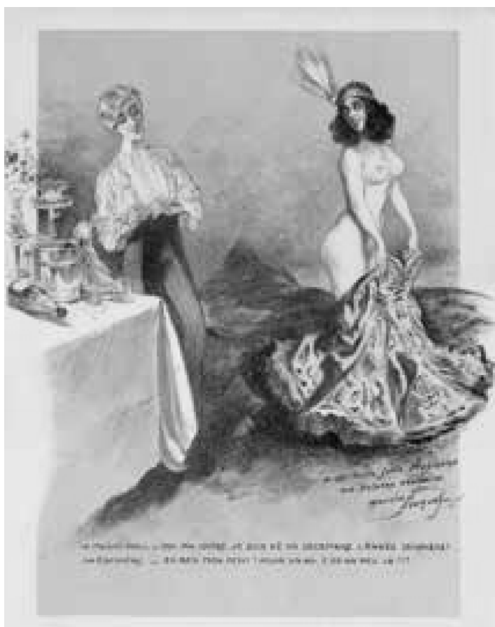
Gravure de Maurice Neumont pour le menu du gala d'anniversaire de la revue Le Music-Hall illustré , 1912 (coll. Marie-Claude Cherqui).

Ce court dialogue illustre à la fois l'importance qu'a prise cette jeune revue dans le monde du spectacle et l'ascension fulgurante de la très jeune Musidora au firmament du music-hall. Plus loin, elle apparaît encore, entourée de Maurice Neumont et de la maison Boinet, costumiers du gala, hommes mûrs couvant la jeune femme qui regarde, elle, l'objectif droit dans les yeux, satisfaite d'être l'objet de l'adoration et des soins de ces