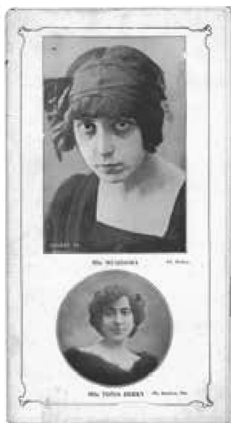
Colette et Musidora, programme pour le spectacle Ça grise ! de Ba-Ta-Clan, 1912.

le Tout-Paris se presse dans ce haut lieu de la revue excentré sur le boulevard Voltaire.