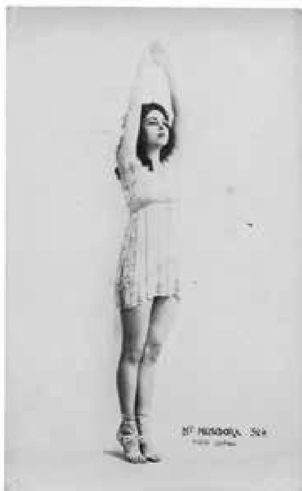
Musidora dans le rôle de La Môme Liquette, La Revue de 1911, carte postale.